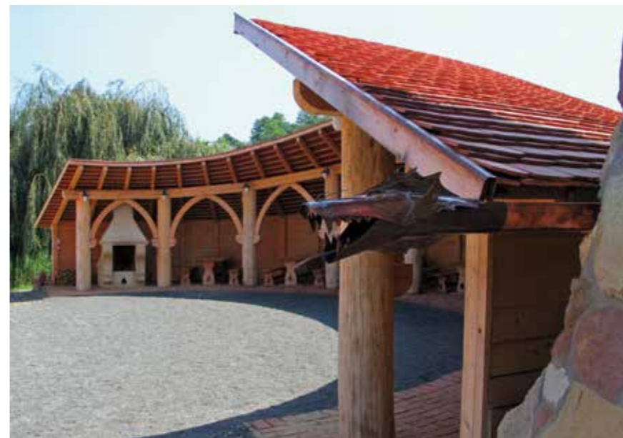
▲ Lovasíjász-központ, Bárdudvarnok