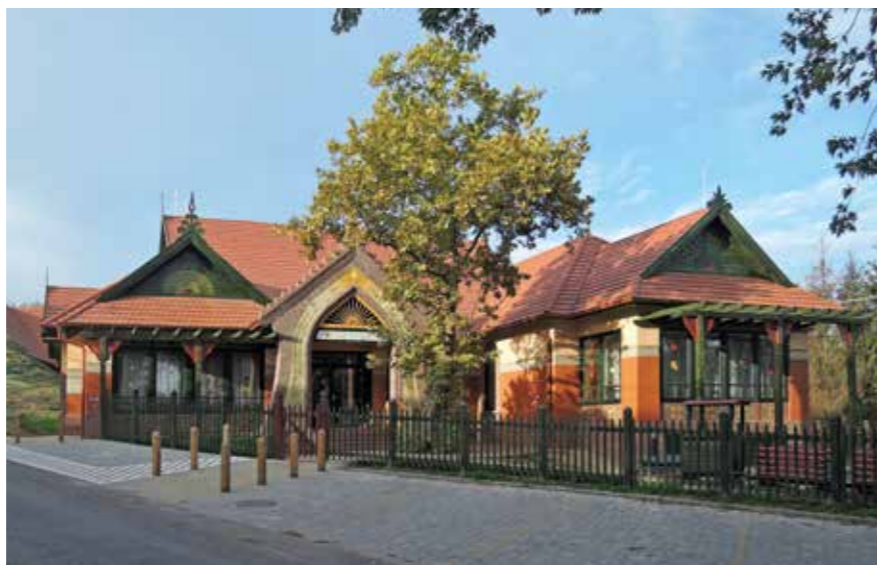
▲ Óvoda, Bárdudvarnok

Lehet, hogy el kell azon gondolkoynom, hogy kell-e ide egyáltalán ház. Lehet, hogy rossz az a kérdés, hogy milyen házat kell ide terveznem. És a rossz kérdésre sosem lehet jól válaszolni. Ha az