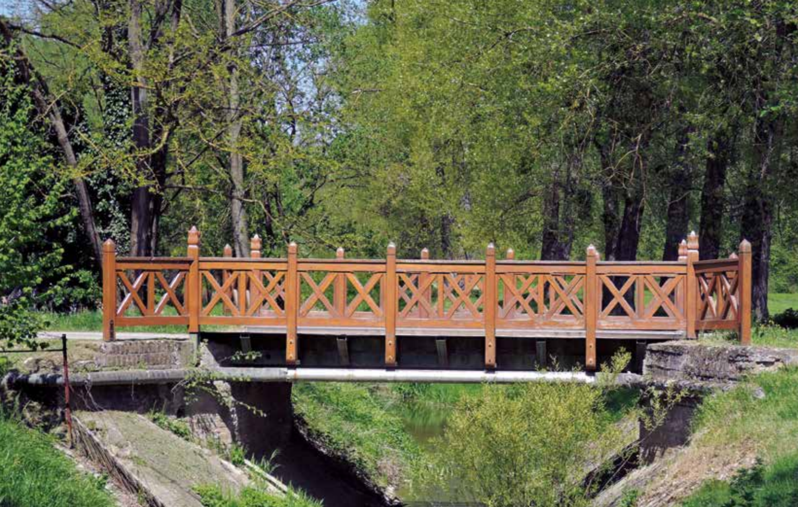
▲ Hídkorlát, Bárdudvarnok