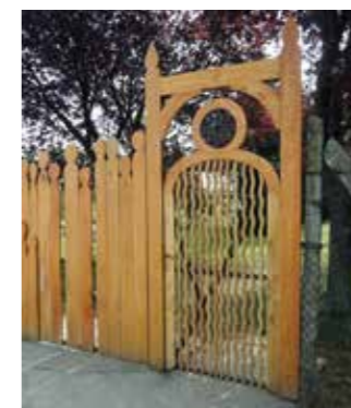
◀ Pince, Bárdudvarnok