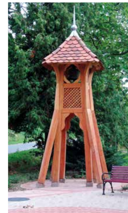
◀ Harangláb, Bárdudvarnok-Lipótfa

Kétségkívül az ember minden pillanatban hatással van a világra. Meggyőződésem, hogy maga az épület is kihat a környezetére. Minden épületnek van kisugárzása, és jótékony hatással tud lenni, ha szép a külseje, és szerethető, barátságos a belseje. Szerintem Makovecz Imre is azt mondaná, ha itt ülne, hogy az épület egy lény. Épületlény. Rezgő, sugárzó lény, valóban erővel és kisugárzással rendelkezik. Ez érzékelhető, és minden alkotásra igaz. Vannak, akik azt állítják, hogy ezt meg is lehet mérni. Itt van az ember felelőssége, hogy mit